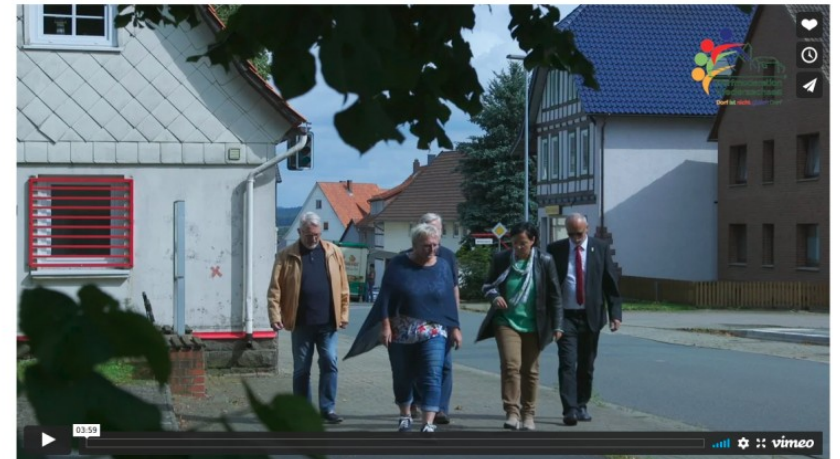
Dorfmoderation Sievershausen, Landkreis Nordheim

Dort sind alle Materialien zum kostenlosen download